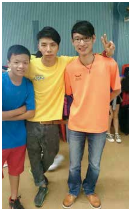
服侍青少年學生的日子

「將你最好的獻給主」。親愛的弟兄姊妹，你今天是否也願意將最好的獻上，回應主基督對你捨命的愛？