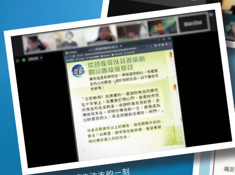
未信者在網上禱告決志的一刻