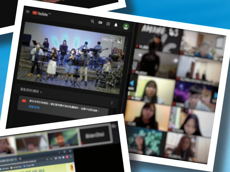
第一次舉辦網上營會，同工善用不同方法與五百多位參與者互動