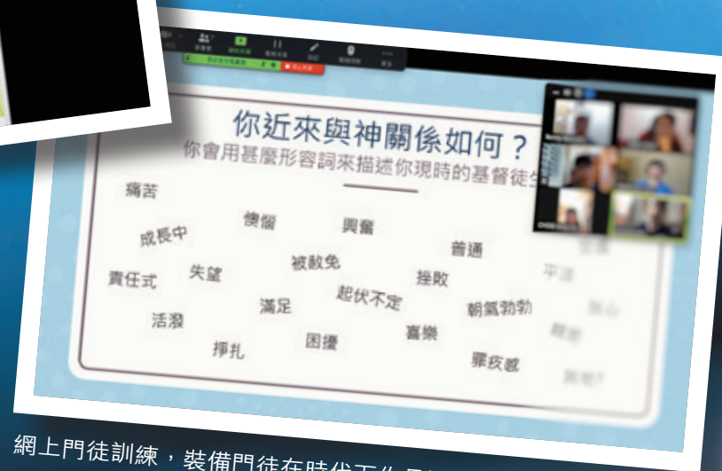
網上門徒訓練，裝備門徒在時代下作見證