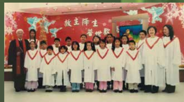
兒童詩班的聖誕節獻唱

也許現在教會無人認識你，無人欣賞或明白你，不妨透過參與事奉，學習彼此同行，認識自己的潛力，也可獲得一份喜悅，人生多一份精彩，少一份遺憾。