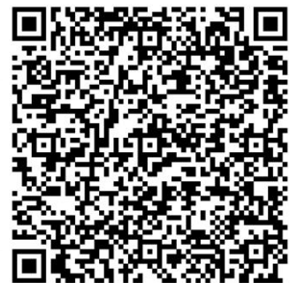
2022 歲終感恩見證會報名表

報名：請填交報名表 (可掃描右面 QR-Code 或登入 https://forms.gle/hD1CevfVin3Y4zC18 )