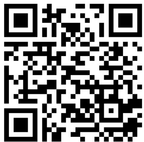
事奉人員退修會報名表