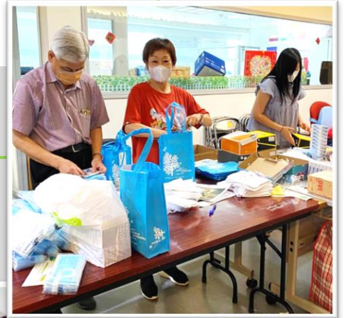
預備禮物盒 長幼齊參與