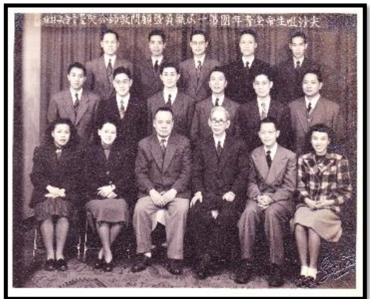
第一屆青年團職員會於 1938 年成立

在團契中我們與神、信徒及非信徒相交，在當中有信仰、愛心及物質的分享，讓團契成為一個 互施、互愛、互享、互有的 合一群體。