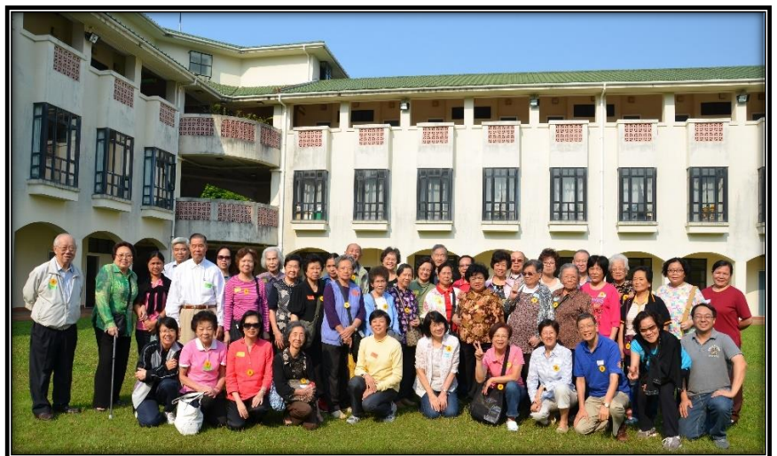
2011年 第一屆長者秋令會