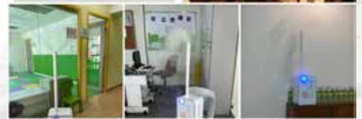
場地消毒 / 崇拜簽到系統 / 網上週刊連結