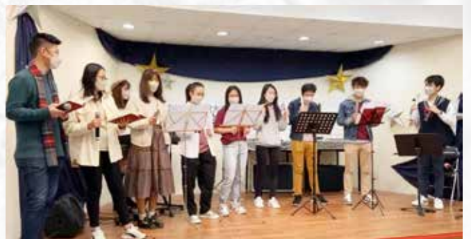
少年詩班參與平安夜福音聚會