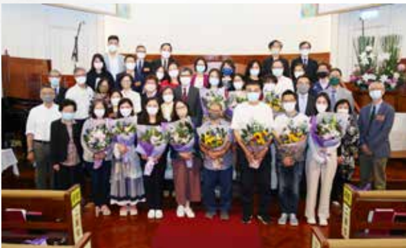
第 147 屆受洗及移名會友大合照

第 147 屆共有 11 位新會友加入尖沙咀堂及 4 位新會友加入葵福支堂。第 148 屆共有 7 位新會友加入尖沙咀堂及 5 位新會友加入葵福支堂。第 145 屆孩童聖禮有 1 位孩童接受奉獻禮。另外本年度總支堂共有 6 位新會友在醫院、家中或護老院受洗，截至 2022 年 12 月 31 日，會友名冊 1839 人，當中有 23 位息勞歸主。