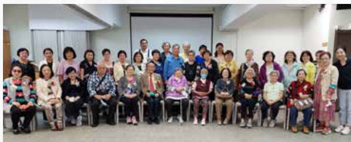
迦勒團敬老主日團契合照 (11 月 20 日)

來年 (2023) 將細分 8 組，每組有 1 位組長負責關顧 4 位團友，期望所有團友都得到更好適切的關顧。