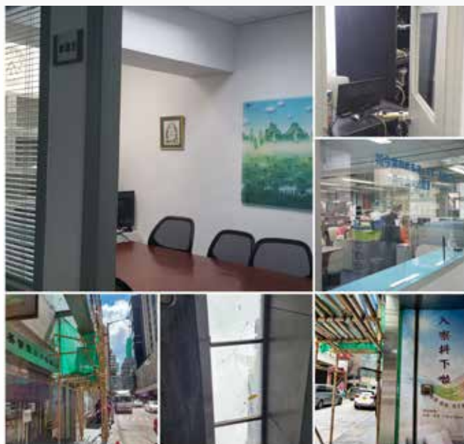
大門口加固及九樓改建工程

九樓改建新電腦室及教會會客室，辦事處入口接待枱位置也更換大型強化玻璃。一樓禮堂及閣樓更換四隻全新喇叭，並使用電腦程式重新調教，室內環境音響效果大大改善。