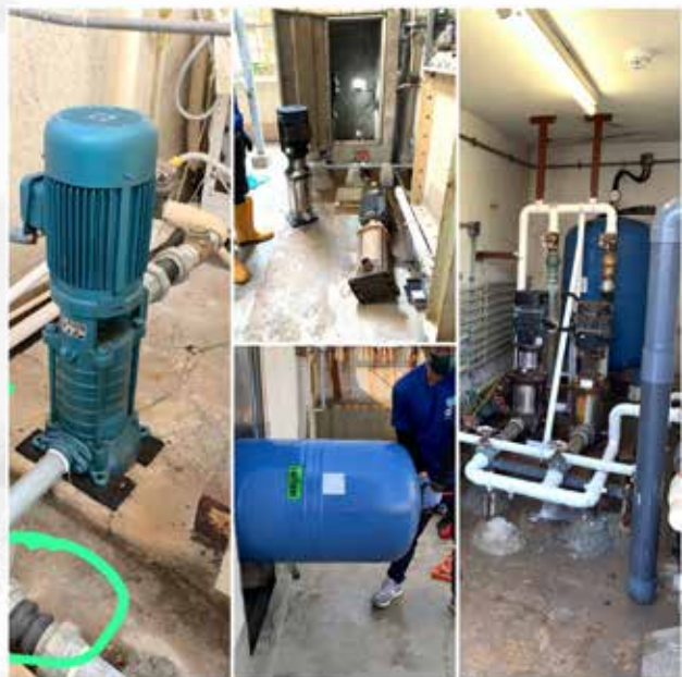
猜一猜 那個是消防泵？鹹水泵？食水泵？