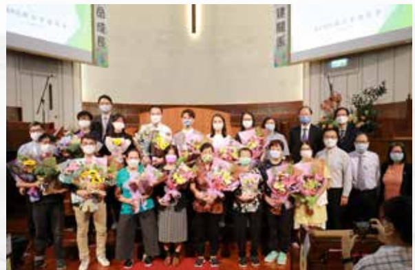
第 148 屆受洗及移名會友大合照